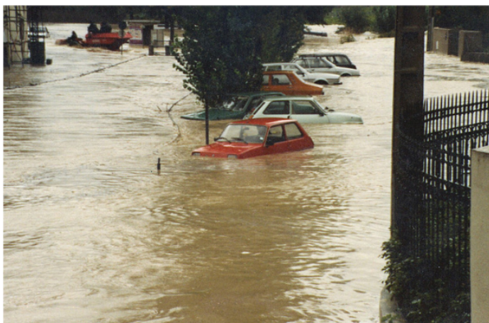
Inondation du quai de la Vène à Montbazin en 1987

S'acculturer au risque signifie vivre en pleine conscience que nous sommes exposés et que l'on peut être amenés à faire face à une crise. Il est donc essentiel de s'adapter et se préparer .