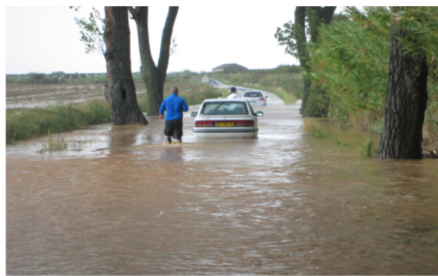
Crue du Soupié à Pinet en 2014 (mairie de Pinet)

La Vène n'est plus sortie à Montbazin depuis 2002, le Soupié à Pinet depuis 2014, et le Pallas à Mèze en 2016, mais le risque d'inondation ne diminue pas pour autant. Il nous faut donc rester vigilants.